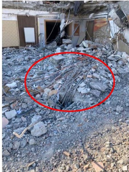
Zemin kat kolon filiz ve donatıları