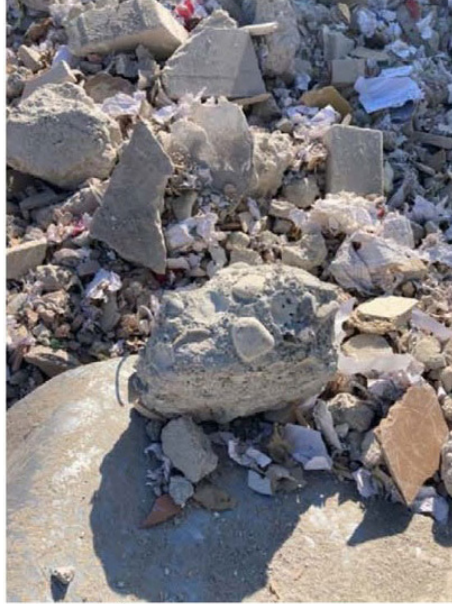
Beton içeriğini gösteren parça

incelenmiştir. Bu uça betonun oldukça pürüzsüz olduğu görülmektedir. Bu da bu kolonun kirişe bağlandığı yerde soğuk derze sahip olduğu kanaati oluşmuştur. Yapılan tespitlere göre temeli ve kolonları 5 kata göre tasarlanıp inşa edilmiş olan söz konusu binanın inşasının doğru yapılmadığı kanaati oluşmuştur. Kat artırımı yapılmasının ciddi bir hata olduğu ve bu binanın düşük depremlerde dahi yıkılmasının mümkün olduğu kanaati oluşmuştur."