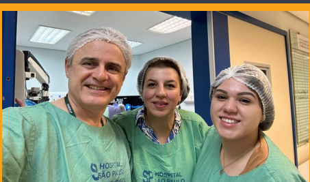
DAÜ Diş Hekimliği Fakültesi Öğretim Üyesi Brezilya'da DAÜ'yü Temsil Etti