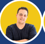
BERTAN GÖRÜŞ Slogan Kurumsal Kurucu